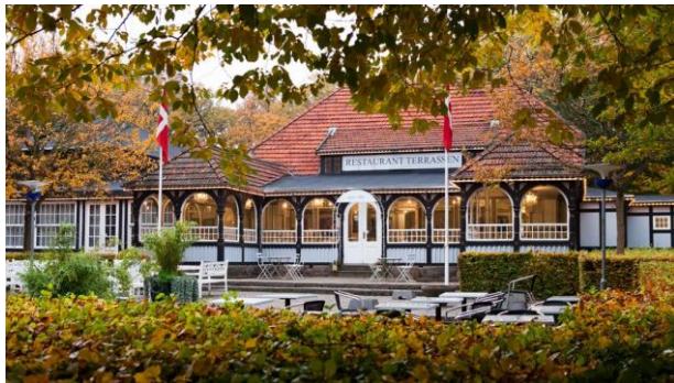
Restaurant Terrassen i Tivoli Friheden